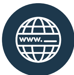
Sitio Web y Presencia en Internet Hasta 2.000€