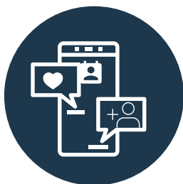
Gestión de Redes Sociales Hasta 2.500€

Estas son las categorías de soluciones digitalizadores que te ofrecemos y, en cada una podrás ver el importe máximo de la ayuda.