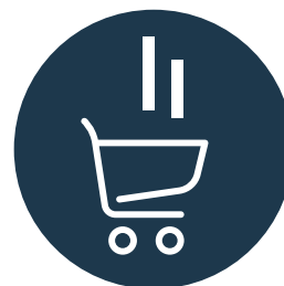
Comercio Electrónico Hasta 2.000€

El programa Kit Digital se enmarca en el Plan de Recuperación, Transformación y Resiliencia, la agenda España Digital 2025 y el Plan de Digitalización de Pymes 2021-2025. Además, está financiado por la Unión Europea – NextGenerationEU.